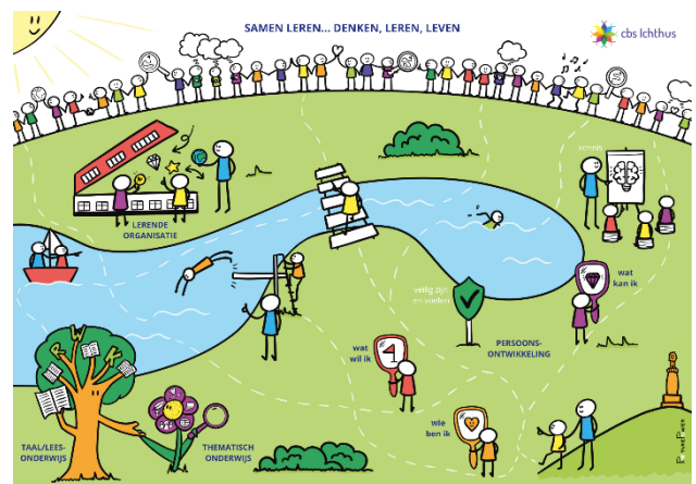
Figuur 2: visualisatie visie en schoolplan 2023-2027